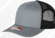
JASPE CLARO NEGRO/127