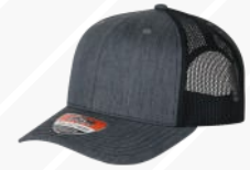
JASPE OSCURO NEGRO/116