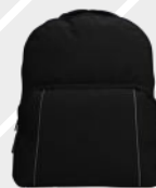
NEGRO JASPE /119