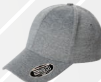
❖ JASPE CLARO/127