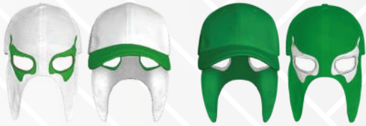
BLANCO OJOS BANDERA/550