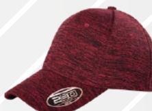
❖ ROJO JASPE/205