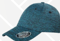
❖ ZAFIRO JASPE/201