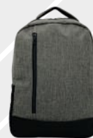
JASPE CLARO / 127