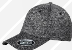
❖ NEGRO JASPE/119